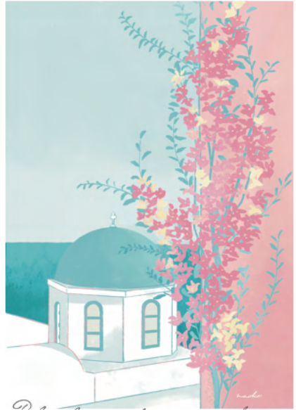
Blue dome and bougainvillea, Santorini