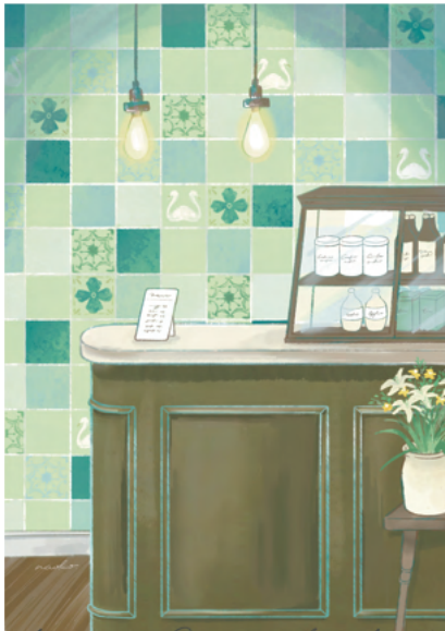
Liberty's, Regent St, London