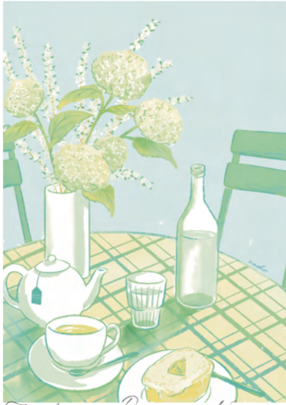
Tea break at Peterham Nurseries