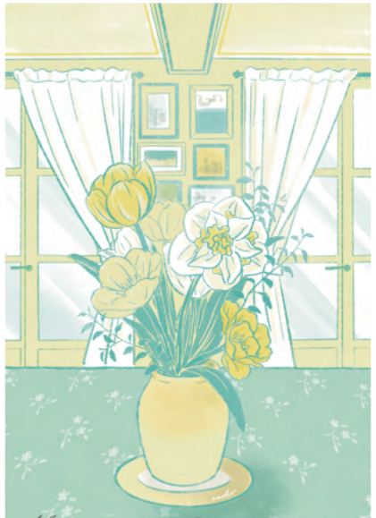
Monet's house, Giverny, France